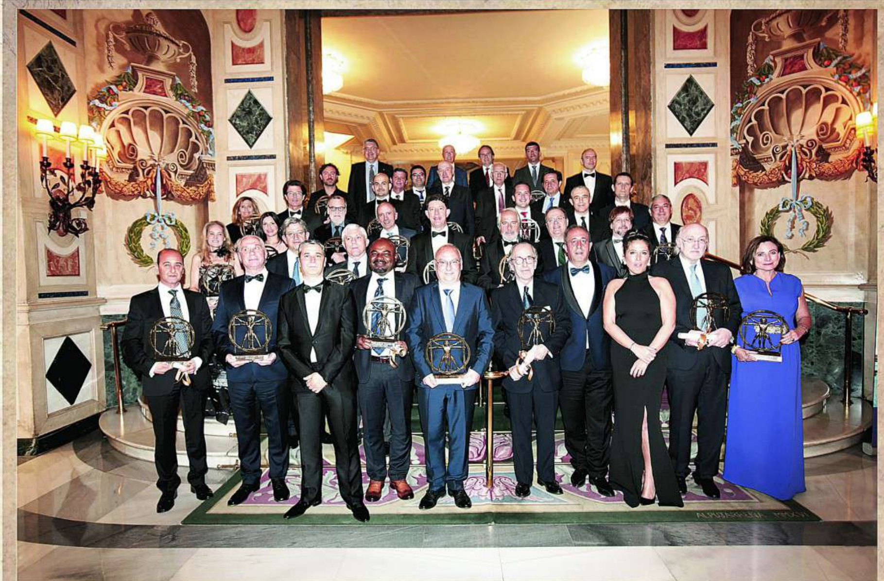
10 de mayo de 2018 - Hotel The Westin Palace - Madrid